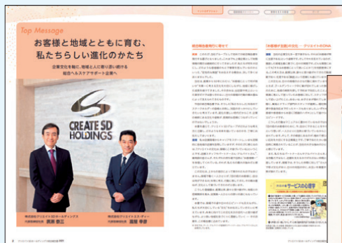
<トップメッセージ>